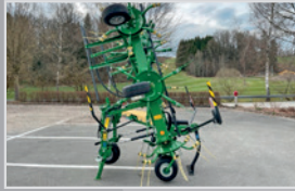
Krone Vendro 820

Bj. 20, Oktolink Fingerkuppung, Fahrwerk mit Beleuchtung, Fließfettgetriebe, Tastrad, GW, VB 21.880,-