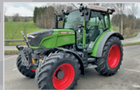
Fendt Vario 207 S Gen 3

Bj. 18, 3.156h, nature green, gef. VA & Kabine, VISIO Kabine mit Klima, Fronthyd. & Zapfwelle, VB 127.990,-