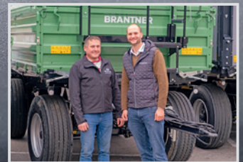
Brantner ZA 14.055 Ch. Steinmann, Mayrhof