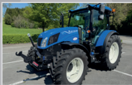
New Holland TD 5.100 S

Bj. 23, 39h, Dynamic Command 0-45 km/h, gefed. VA & Kabine, DL Bremse, Fronthydraulik, VB 99.990,-