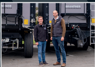
Brantner ZA 20.051 Schneebauer, St. Marienk.