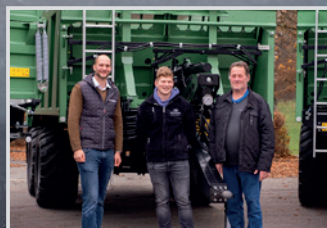
Brantner PP 16.055 Fam. Berndorfer, Freinberg