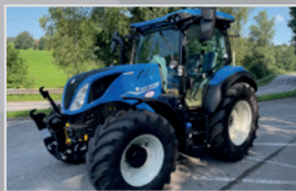
New Holland T 5.110 DC

Bj. 05, 6.789h, 4,5l Hubraum, Elektro Command 40 km/h, Deluxe Kabine mit Klima, Druckluftbremse, VB 47.990,-