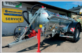
Vakutec VA 9500

Tandem, Bj. 24, Bereifung 710/55 R 26,5, Lenkachse, Untenanhängung, VAI Kompressor, Druckluft, Typenschein, Sonderpreis