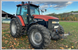
Fiatagri M 100

Allrad, Bj. 23, 3 Zylinder mit 25 PS, Hydrostatischer Fahntrieb, 2 DW Steuergeräte, Überrollbügel, VB 16.990,-