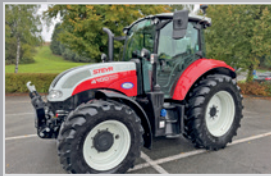
Steyr Multi 4100 Profi

Bj. 15, 3.567h, FPT Motor 6,7l, CVT Getriebe stufenlos mit 50 km/h, gef. VA & Kabine, Deluxe Kabine, VA, VB 119.990,-