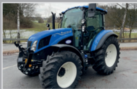
New Holland T 5.90 DC

Bj. 24, 19h, 3,6l Hubraum, Power Shuttle, Deluxe Kabine, Klima, Lift-o-matic, DL Bremse, DW Steuergeräte, VB 59.990,-