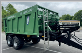
Brantner Power Push

TA 23063 PP, Bj. 25, 32to Federaggr., hydr. Stützfuß, Kugelkopf K80, Ber. 710/50 R 26,5, Lenkachse, Black Edition, VB 62.880,-