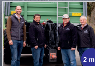
Brantner TA 14.045 Fam. Amesberger, Enzenk.