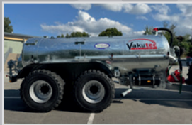
Vakutec VA 10500, Tandem

Vakuuffass, Bj. 23, Bereif. 850/50/30,5, 12 m Schleppschuhverteiler, Duplex Düsen, Vorführgerät 2024, VB 82.990,-