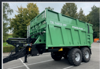
Brantner PP 16.055 Niklas Rücklinger, Sauwald