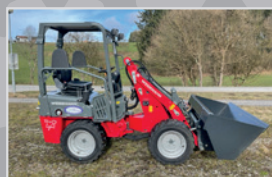
Weidemann 1140 light

Bj. 25, 21h, 25PS Motor, Kabine m. Heizung & Lüftung, Komfortsitz, Radio, Hubkraft 1,5 to, VB 47.990,-