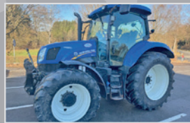
New Holland T 6.160 AC

Bj. 25, 6 Zylinder FPT Motor, BLUE Power, Dyn. Command Getriebe von 0-50 km/h, Fronthyd./Zapfwelle, VA, VB 149.990,-