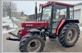
Case 840 Allrad

Bj. 85, Steyr Komfortkab., Hecksch., Hydr. Frontlader+Schaukel, Einhebelsteuerung., 3 DW Steuerge., Schnelkup., Arbeitss., VB 18.990,-