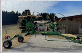
Krone Seitenschwader TS 620

TWIN, Bj. 22, 13/13 Zinkenarme, Dura Max Kurvenbahn, Lift Zinken, Tandemachse, Breitreifen, VB 26.490,-