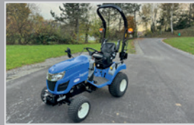
New Holland Boomer 25 C

Bj. 25, 6h, Motor FPT 12/12, Shuttle Getriebe 40 km/h, Deluxe Kabine, Beifahrersitz, Fronthydraulik, VB 46.990,-