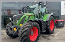
Fendt Vario 724 GEN 6

Gebrauchtmaschinen *Inventurbonus -3 % bis 31.12.2025 sichern!