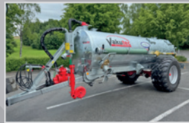
Vakutec VA 7300

Bj. 24, Bereif. 710/55 R 26,5, Lenkachse, Untenanhängung, VAI Kompressor, Druckluft, Typenschein, VB 52.990,-