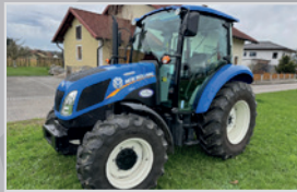
New Holland T 4.75

Bj. 21, 149h, 4 Zylinder FPT Motor, Power Shuttle Getriebe 40 km/h, Deluxe Kabine, Luft- und Beifahrersitz, VB 46.990,-