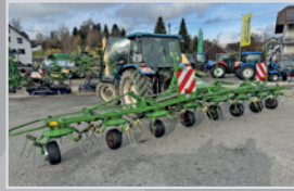
Krone Vendro 7.92/8

Bj. 24/25, Oktolink Fingerkuppung, Opti Turn Zinken mit 10 Jahre Garantie, Fließfettgetriebe, VB 18.990,-