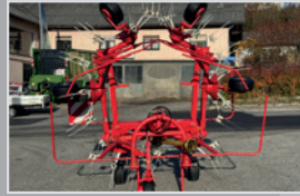
Pöttinger Kreiselheuer HIT 69 N

Bj. 11, Oktolink Fingerkuppung, Opti Turn Zinken mit 10 Jahre Garantie, Fließfettgetriebe, VB 9.990,-