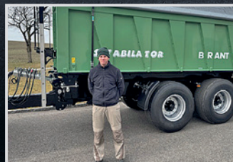
Brantner ZA 18.051 P. Diebetsberger, Diersbach