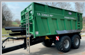
Brantner Power Push

TA 23071 PP, Bj. 23, 32 to Federaggregat, hydr. Stützfuß, Kugelkopf K 80, Bereif. 710/50 R 26,5, Lenkachse, VB 62.880,-