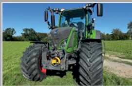
Fendt Vario 516 SCR

Profi Plus, Bj. 25, 256h, gef. VA & Kabine, Komfortkabine VISIO, hydr. Oberlenker, autom. AHK, VB 239.990,-