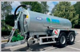
Bauer Vakuuffass V 155 TL

Einachs, Bj. 24, Schleppschuhvorb., Syphon 20L, Untenanhängung, WWGW, Thalfahrts., VB 23.990,-