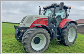
Steyr 6165 Hi - eSCR

Bj. 97, 12.213h, 6 Zyl. IVCO Motor, Lastschaltgetr. 40km/h, Fronthydr., hydr. Oberl., Brandschaden, fahrbereit, VB 19.990,-