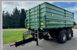
Brantner TA 20051 2/XXL

TA 16.055, Bj. 24, Ladevolumen 20 m³, Druckluftbremse mit ALB Regler, Typenschein, Bereifung 560/45R-22,5; VB 37.990,-