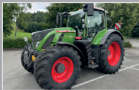
Fendt Vario 718

Profi Plus, Bj. 25, 56h, gef. VA & Kabine, Spurführungssystem RTK, Infotainmentsystem, VB 271.990,-