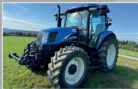
New Holland TSA 110

Bj. 14, 6.789h, 4,5l Hubraum, Auto Command Getriebe mit 50 km/h, Deluxe Kabine mit Klima, Kabinenfed., VB 72.990,-