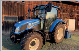
New Holland T 4.75

Bj. 16, 5.567h, 4 Zylinder FPT Motor, Power Shuttle, Deluxe Kabine, Klimaanlage, 2 DW Steuergeräte, VB 31.990,-