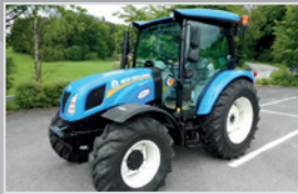
New Holland T 4.55 S

Bj. 07, 2.617h, 32/16 Synchro Shuttle 40 km/h, Deluxe Kabine, Luftsitz, Fronthydraulik, Bauhöhe 2.320 mm, VB 34.990,-