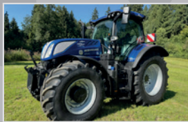
New Holland T 7.225 AC

Bj. 18, 1.789h, Fullpowershift 19/6 Getriebe mit 50 km/h, gef. VA & Kabine, Fronthyd. & Zapfwelle, VB 96.990,-