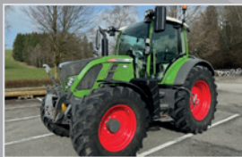
Fendt Vario 512 Plus

Profi Plus, Bj. 21, 1.790h, nature green, gef. VA & Kabine, Spurführungssystem RTK, Section Controllsystem, VB 152.990,-