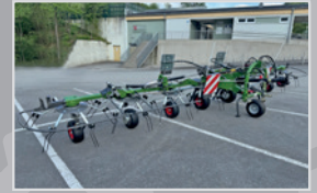
Fendt Twister 8606 DN

HIT 69 N, Bj. 08, hydr. Hochstellung, Dämpferstreben, Tastrad vorne, Gelenkwelle, VB 5.290,-