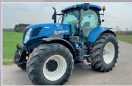
New Holland T 7.220 AC

Bj. 15, 6768h, Auto Command 0-50 km/h, gef. VA & Kabine, Fronthyd. & Zapfwelle, Stoll FL Konsole, Monitor, VB 99.990,-