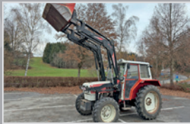
Steyr 8065 Allrad

Bj. 21, 1.067h, 4 Zylinder FPT Motor, 16/16 Gang Getriebe mit 40 km/h und 4 fach Lastschaltung, Multicontroller, VB 71.990,-