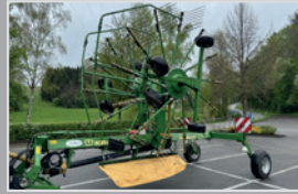
Krone Swadro 800/26

Bj. 25, 4-fach Mittelschwader, LIFT Zinken, Easy Line Antrieb, Bereifung 620/40R22,5, Terminal DS 500, VB 71.990,-