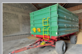
Agromet 2 Achs-3 Seitenkipper

Dreiseitenkipper FF 8000, Bj. 24, Brücke 4.140x2.150 mm, Bordwände 2x600 mm abklappbar, Druckluftbremse, VB 15.890,-