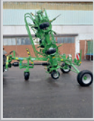
Krone KWT 10-02/10

Bj. 20, Oktolink Fingerkuppung, Fahrwerk mit Beleuchtung, Fließfettgetriebe, Tastrad, GW, VB 21.880,-