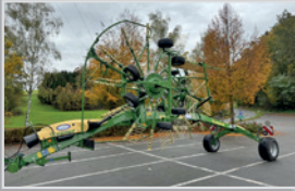
Krone Seitenschwader TS 680

Bj. 24, 8.600 mm AB, Zinkenverlustersicherung, hydr. Grenzstreueinrichtung, Beleuchtung, Gelenkwelle, VB 17.390,-