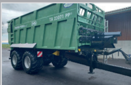
Brantner Power Push

TA 23071 PP, Bj. 23, 32 to Federaggregat, hydr. Stützfuß, Kugelkopf K 80, Bereif. 710/50 R 26,5, Lenkachse, VB 62.880,-