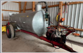
Morawetz VA 4600

Bj. 22, Tandemaggregat, Lenkachse, Bereifung 800/45R 26,5 BKT, Pendelverteiler, Untenanhängung, K 80, VB 66.990,-