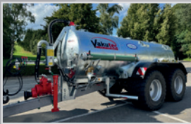
Vakutec VA 10500

Tandem, Bj. 24, Bereifung 710/55 R 26,5, Lenkachse, Untenanhängung, VAI Kompressor, Druckluft, Typenschein, Sonderpreis