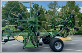
Krone Swadro TC 1250

Bj. 22, 10/13 Zinkenarme, Dura Max Kurvenbahn, Lift Zinken, Tandemachse, Breitreifen, VB 22.990,-