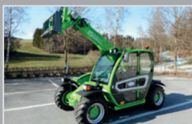
Merlo Teelader 27.6

Bj. 92, 6345h Komfortkabine, Heizung und Lüftung, Fronthydraulik, Breitreifen, VB 18.990,-