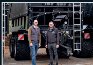
Brantner PP 23.063 P. Eichetshammer, Antiesenh.