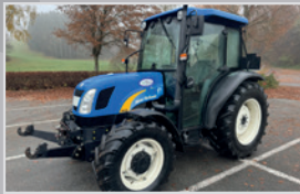
New Holland TN 60 DA

Bj. 25, FPT Motor, Synchro Shuttle Getriebe 40 km/h, Deluxe Kabine, Klima, Luft- und Beifahrersitz, VB 48.990,-