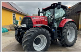
Case IH Puma 165

Bj. 25, 19h, 3 Zylinder, 80 PS, Vario Getriebe von 0-45 km/h, Luftfedersitz, 2 DW Steuergeräte, VB 86.990,-