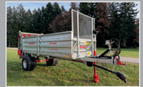
Gruber Stallmiststreuer SM 650

TA 12050 Power Spread, Bj. 25, Bereifung 500/50 R-17, F4V Feinstreuzwerk, geteilter Kratzboden, WWGW, VB 37.990,-