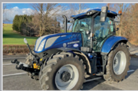
New Holland T 6.180 DC

Bj. 11, 4768h, Auto Command 0-50 km/h, gef. VA & Kabine, Fronthyd./Zapfwelle, Stoll FL Konsole, Monitor, VB 94.990,-