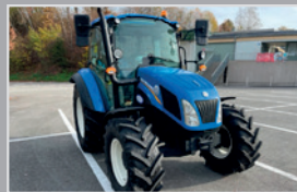
New Holland T 4.75 S

Bj. 25, 3,6l Hubraum, Power Shuttle, Lastschaltung, Deluxe Kabine, Klima, DL Bremse, Super Steer Achse, VB 65.990,-