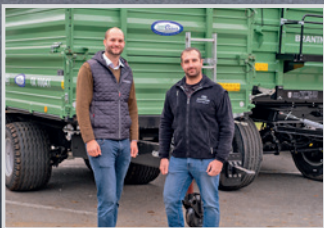
Brantner TA 10.045 B. Schönbauer, Esternberg