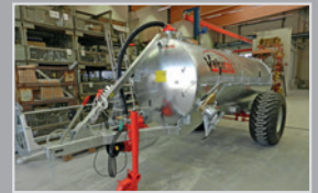
Vakutec VA 6500

Einachs, Bj. 24, Schleppschuhvorb., Syphon 20L, Untenanhängung, WWGW, Thalfahrts., VB 29.990,-