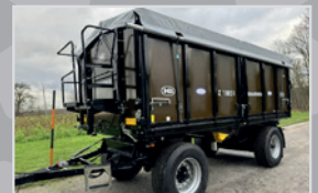
Brantner 2 Achs-Dreiseitenkipper

Bj. 23, 20to GGW, Brücke 5.150x2.480 mm, 2x800 mm Bordwände, Bereifung 560/65R22,5, Typenschein, VB 35.990,-